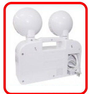
COMPARTIMENTO PARA CABLES