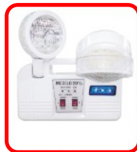
FAROS AJUSTABLES CON PANTALLA PRISMÁTICA LUZ LED ULTRA BRILLANTES